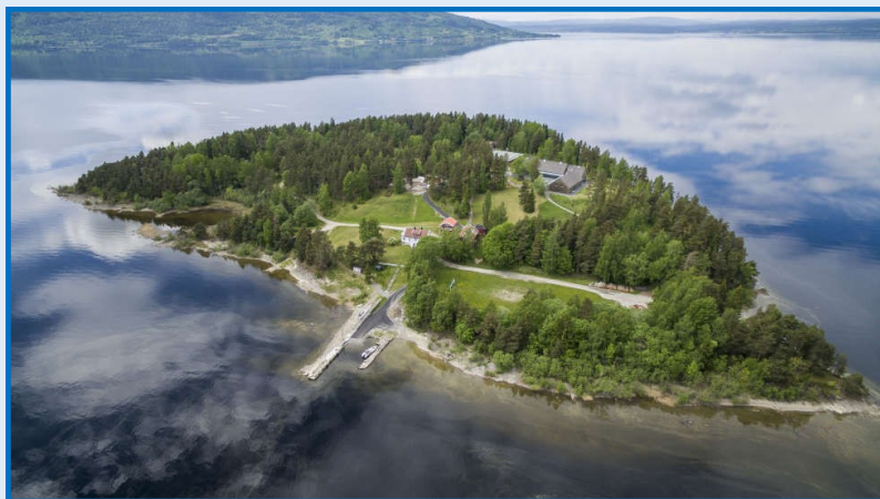
Utøya.

Gjerningsmannen Anders Behring Breivik ble pågrepet av politiets beredskapstropp på Utøya kl. 18.34. Under avhør og i sin forklaring i Oslo tingrett oppga han høyreekstremistiske og islamfiendtlige politiske motiver for terrorhandlingene. Tiltalte begrunnet angrepene som et forsvar mot et politisk styrt og hemmelig «multikulturelt prosjekt». Han mente at etniske nordmenn var blitt utsatt for overgrep i form av etnisk «dekonstruksjon» siden Arbeiderpartiet åpnet for masseinnvandring i 1960-årene. Alle partiene på Stortinget, men særlig Arbeiderpartiet, er ansvarlige for dette, ifølge ham.